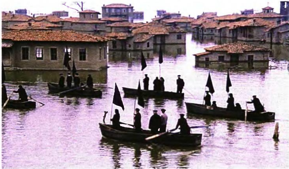
Ο Γιώργος Πάτσας έκανε τα σκηνικά της ταινίας του Θ. Αγγελόπουλου «Το λιβάδι που δακρύζει»